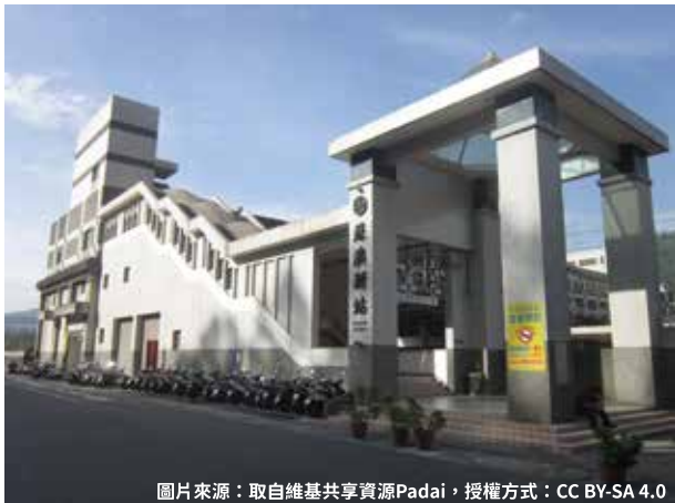
圖片來源：取自維基共享資源Padai，授權方式：CC BY-SA 4.0