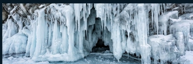
冰掛與冰洞 (Icicles & Ice Caves)