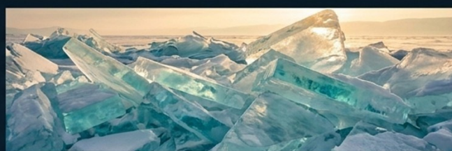
冰堆 (Ice Hummocks)