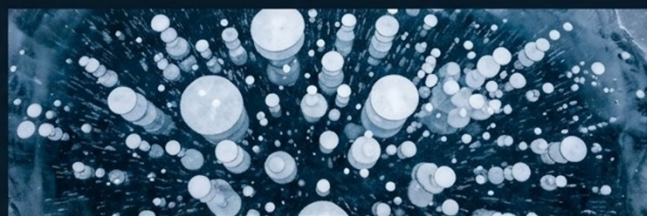
氣泡冰 (Bubble Ice)