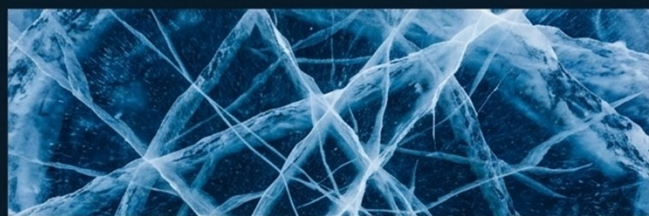
裂紋藍冰 (Cracked Blue Ice)