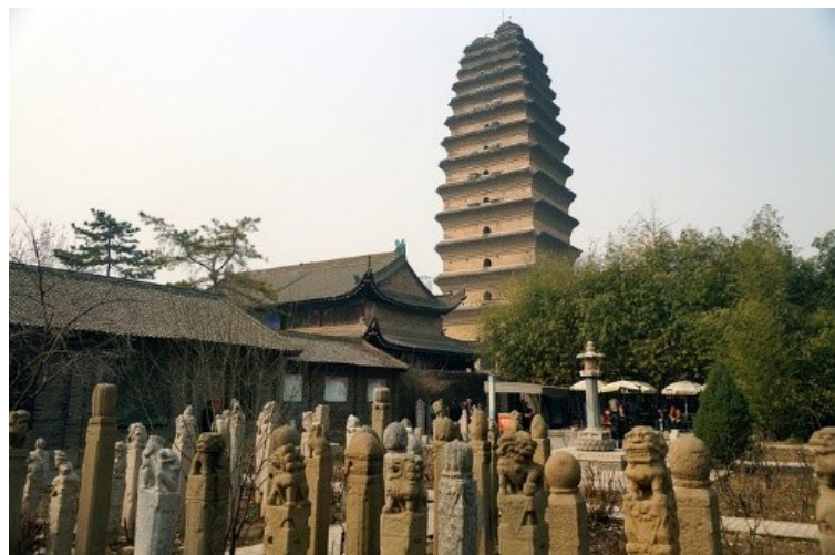
■ 西安博物院-小雁塔

以回族美食聞名，匯集各式在地小吃，街區熱鬧，充滿傳統風情，是體驗西安飲食文化的熱門地點。