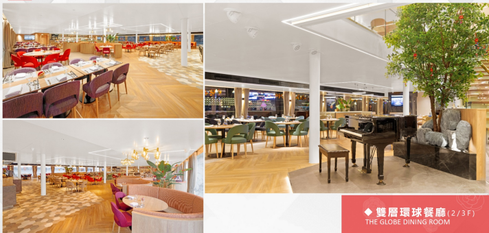
◆ 雙層環球餐廳 (2/3F) THE GLOBE DINING ROOM