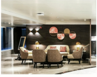
◆ 中央大堂 (2F) GRAND LOBBY