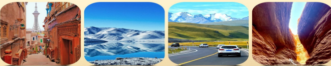
老城區 千年迷宮，西域煙火