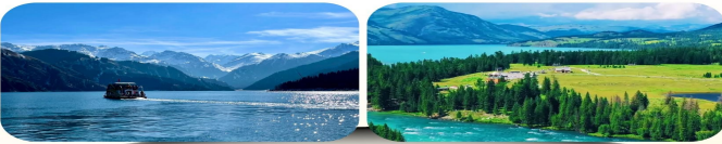
天山天池 瑤池天鏡，松林環抱