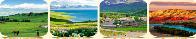
那拉提草原 河谷草原，牧歌飛揚