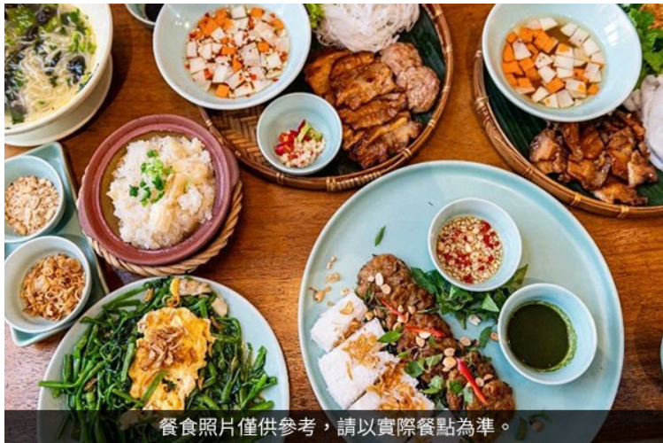
餐食照片僅供參考，請以實際餐點為準。

安排多樣美食體驗，包含米其林推薦餐廳 Ngon Garden、Luk Lak Vietnamese Restaurant、於 InterContinental Halong Bay Resort 享用西式套餐，在 Paradise Legacy Cruise 船上享用精緻自助餐，以及 Sofitel Legend Metropole Hanoi Angelina 餐廳品味義式下午茶；KASAYA 越式精緻蔬食餐，呈現多元越南風味。