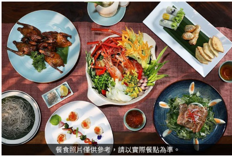
餐食照片僅供參考，請以實際餐點為準。

安排多樣美食體驗，包含米其林推薦餐廳 Ngon Garden、Luk Lak Vietnamese Restaurant、於 InterContinental Halong Bay Resort 享用西式套餐，在 Paradise Legacy Cruise 船上享用精緻自助餐，以及 Sofitel Legend Metropole Hanoi Angelina 餐廳品味義式下午茶；KASAYA 越式精緻蔬食餐，呈現多元越南風味。