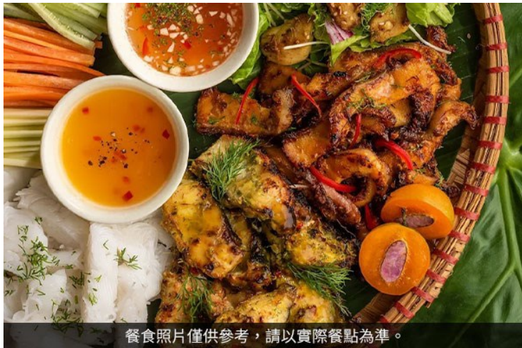
餐食照片僅供參考，請以實際餐點為準。